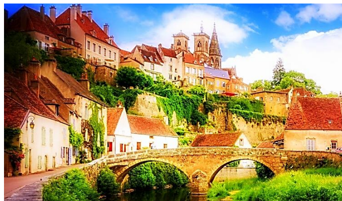
Borgogna: APPARTENERE ALLA TERRA - 13-21/8/2023