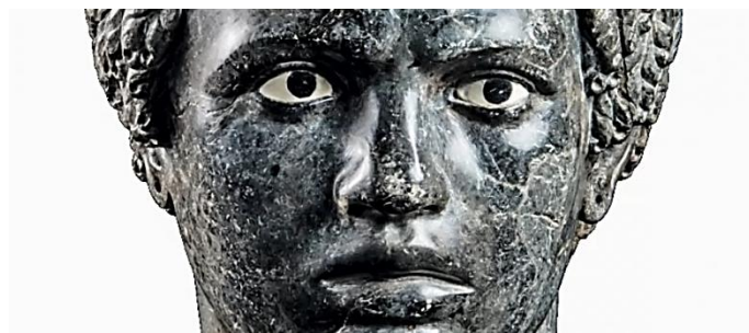
Roma: GLI DÈI RITORNANO – 3-5/10/2023