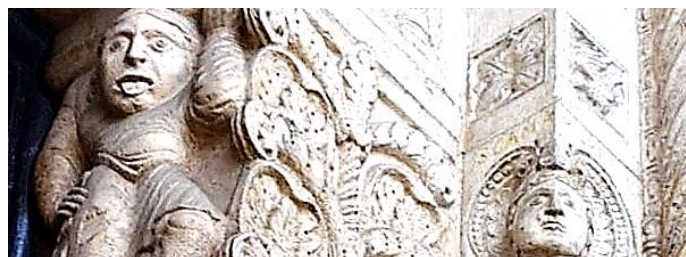
Ferrara e Modena: SIMBOLI E SEGRETI – 15-16/9/2023