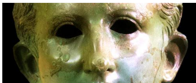
16-19/3/23 – UMBRIA: ARCHEOLOGIA PAGANA